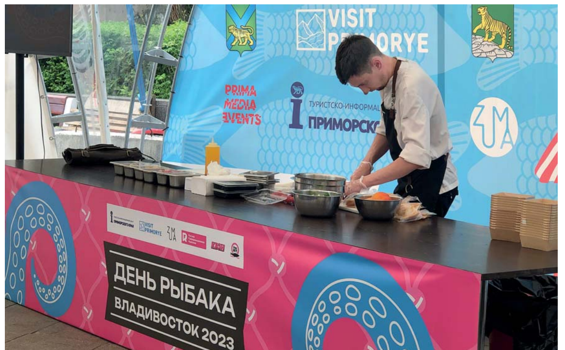
Специалисты научили не только готовить дары моря, но и правильно выбирать и хранить их