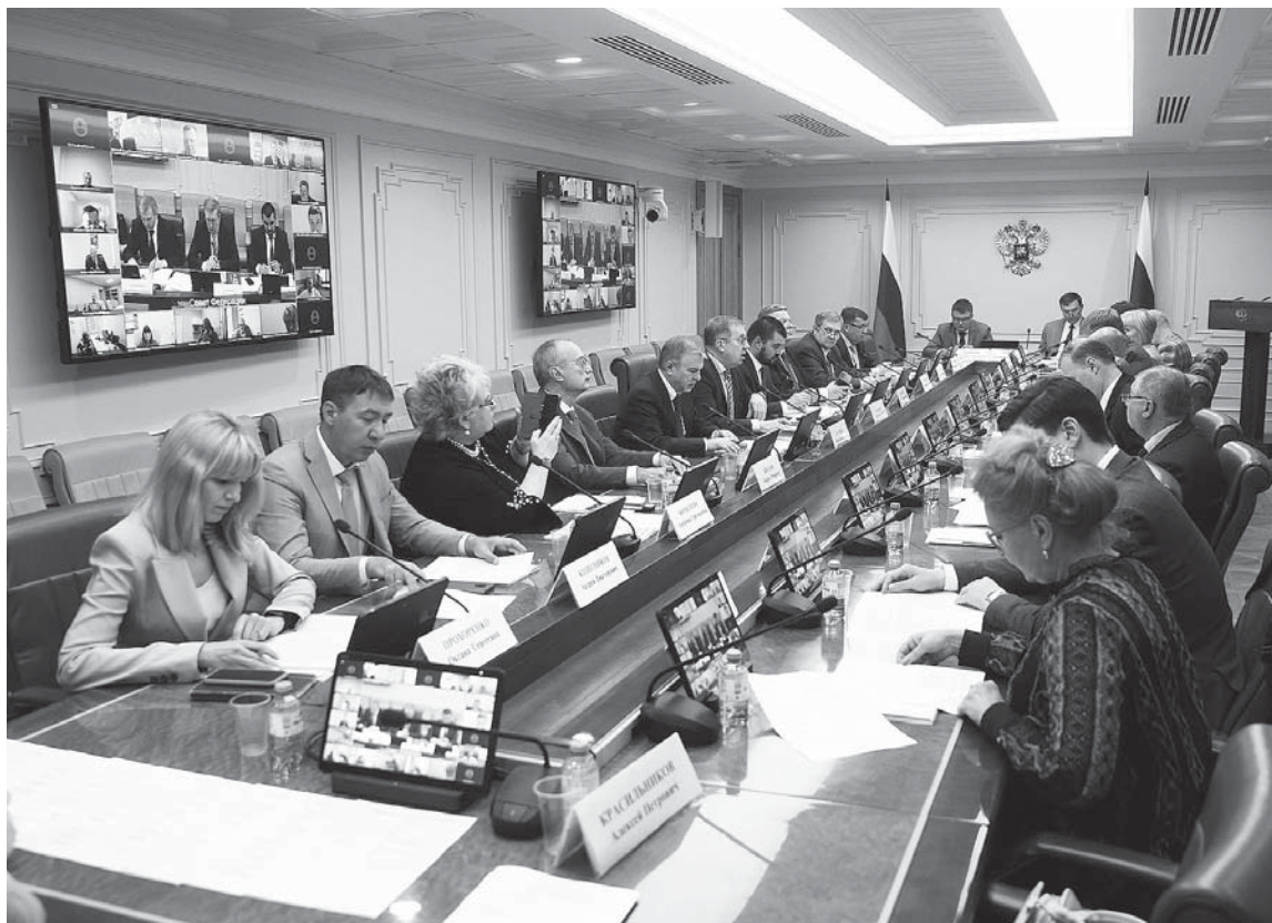
Круглый стол по развитию логистических коридоров прошел в Совфеде

Архангельская область предложила расширить список судов, которые могут воспользоваться субсидией на организацию регулярных перевозок по Северному морскому пути. В частности, распространить льготу на рефрижераторы с рыбой.