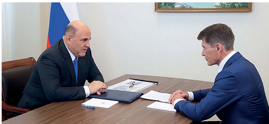
Премьер-министр Михаил МИШУСТИН провел встречу с губернатором Приморского края Олегом КОЖЕМЯКО