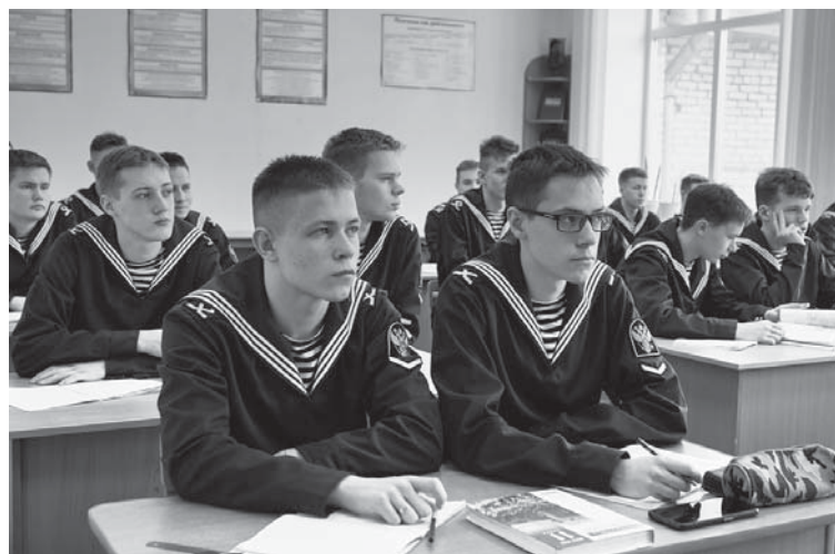
Прием документов на обучение в Высшей школе рыболовства и морских технологий САФУ ведется до 15 августа

Напомним, согласно российскому законодательству, на получение статуса органической может претендовать в том числе продукция аквакультуры. FN