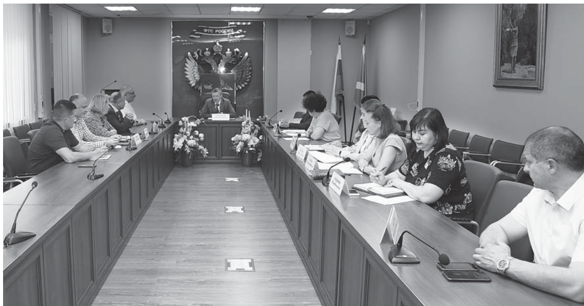
В Калининграде состоялась рабочая встреча по вопросу использования рыболовных судов, помещенных под таможенную процедуру СТЗ

В Калининграде прошла рабочая встреча по вопросу использования рыболовных судов, помещенных под таможенную процедуру свободной таможенной зоны. Разъяснения потребовались в связи с режимом особой экономической зоны в регионе.