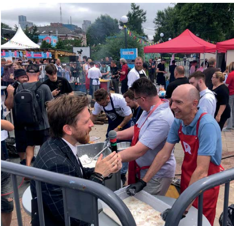
Главным событием праздника стал гастрономический фестиваль

Событие не оставило равнодушными ни взрослых, ни детей. Для маленьких гостей была организована специальная зона мастер-классов, где они смогли попробовать себя в самых разных начинаниях. А пока дети были под присмотром, родители могли посетить выставку маринистов, приобрести сувениры с морской тематикой, а также поучаствовать в мастер-классах по живописи, работе с войлоком и росписи ракушек.