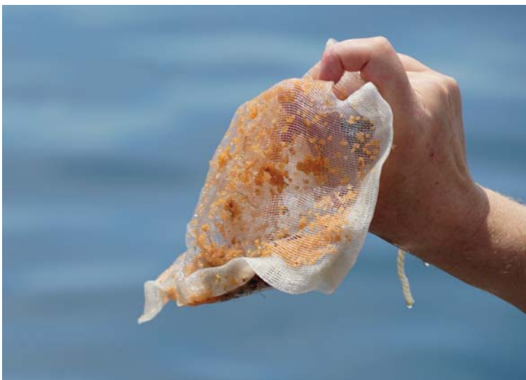
Мальки камчатского краба на МБС «Запад»