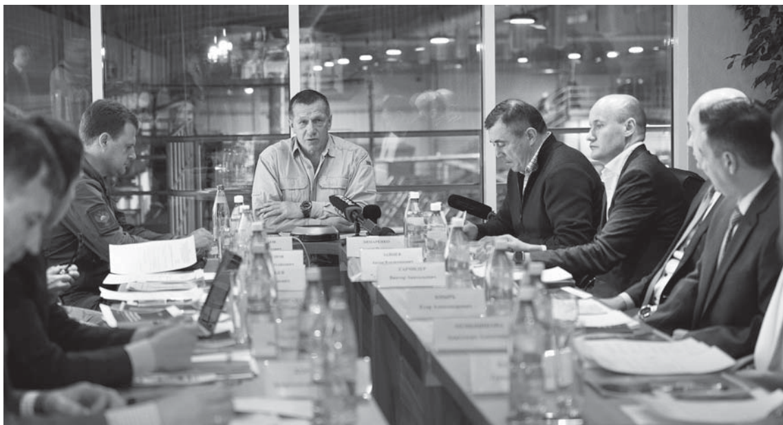
Юрий ТРУТНЕВ и руководство Сахалинской области обсудили новые проекты для привлечения инвестиций на Сахалин и Курилы