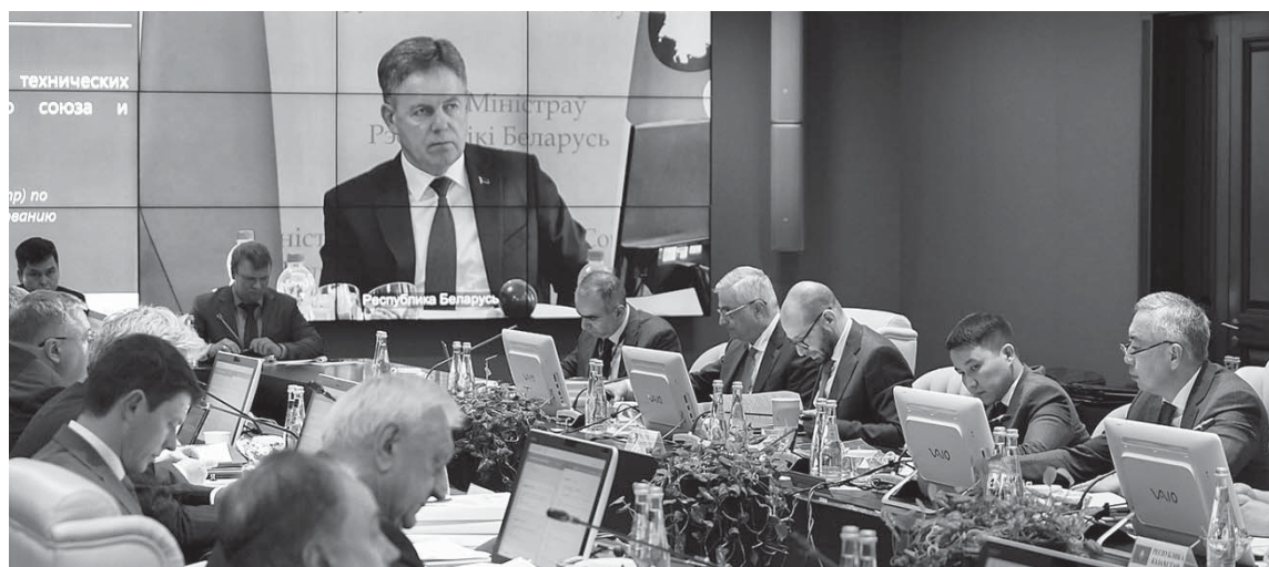
Совет ЕЭК внес изменения в техрегламент «О безопасности пищевой продукции»

Изменения устанавливаются максимально допустимые уровни остаточных количеств для 75 ветеринарных лекарственных средств в переработанной пищевой продукции животного происхождения. Это новое концептуальное направление, не