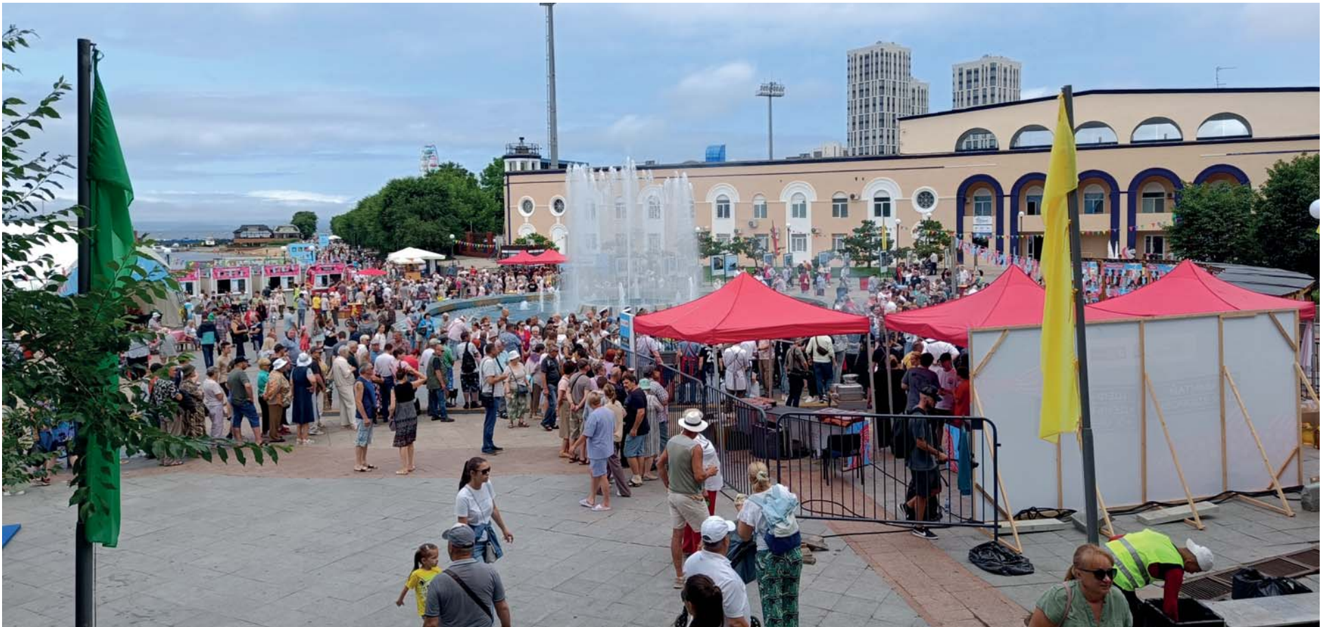
День рыбака собрал несколько тысяч жителей и гостей города