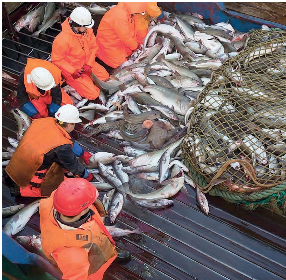
О результатах и перспективных проектах в «Норебо» рассказали в преддверии Дня рыбака

«Преемственность в рыбацком деле — это очень важно. Мы хотим показать ребятам, насколько интересна и в то же время ответственна и сложна работа в море, помочь им в профессиональном становлении», — подчеркнули в «Норебо». FN