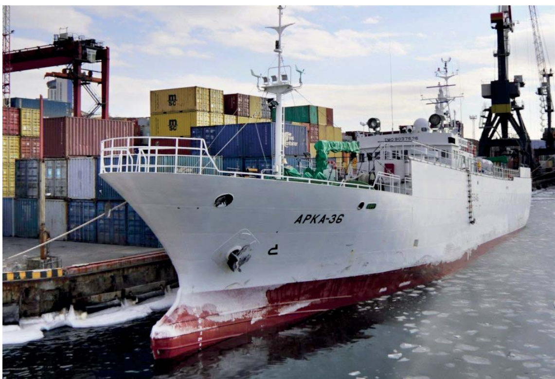
«Арка-36» вернулась из полугодичного рейса с рекордным уловом — более 1400 тонн краба