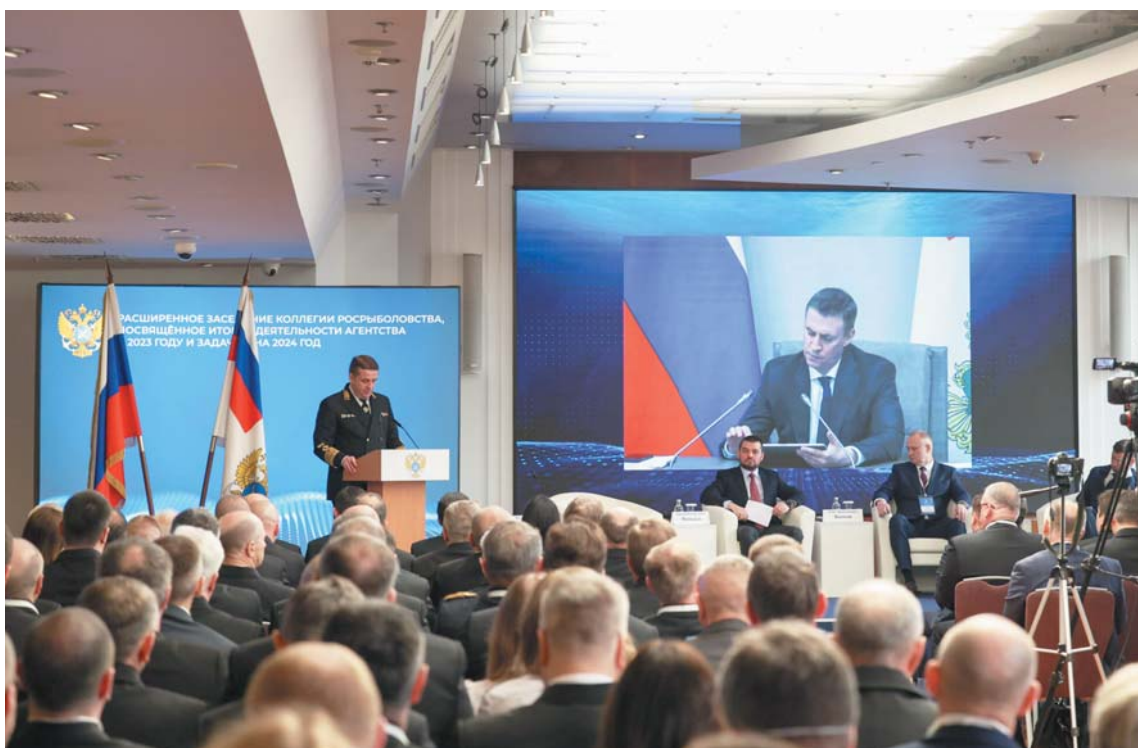
Руководитель Росрыболовства Илья ШЕСТАКОВ и глава Минсельхоза Дмитрий ПАТРУШЕВ отчитались о показателях рыбной отрасли за прошедший год