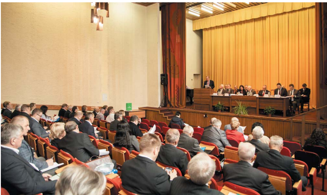
Ассоциация «Росрыбхоз» подвела годовые итоги на заседании совета в подмосковном Голицыне