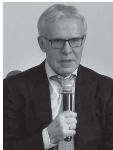
Вячеслав ФЕТИСОВ, председатель Всероссийского общества охраны природы (ВООП)