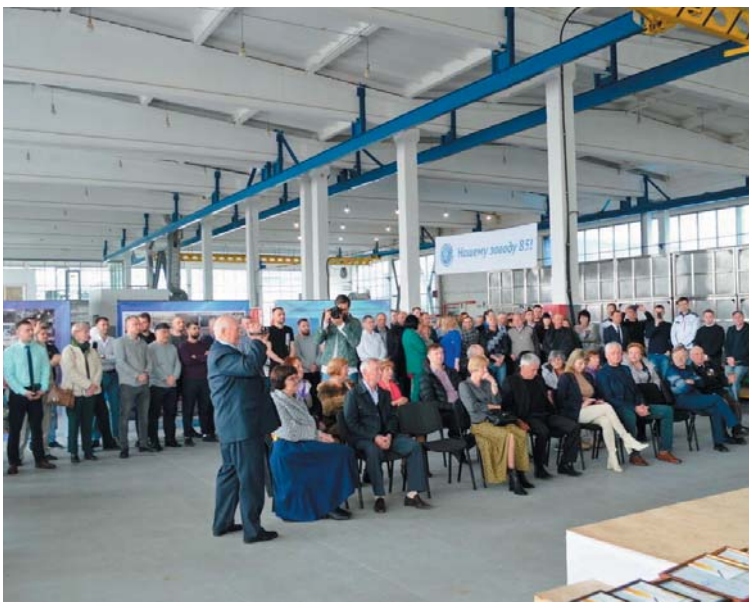
Главное богатство ДРТЦ — трудовой коллектив