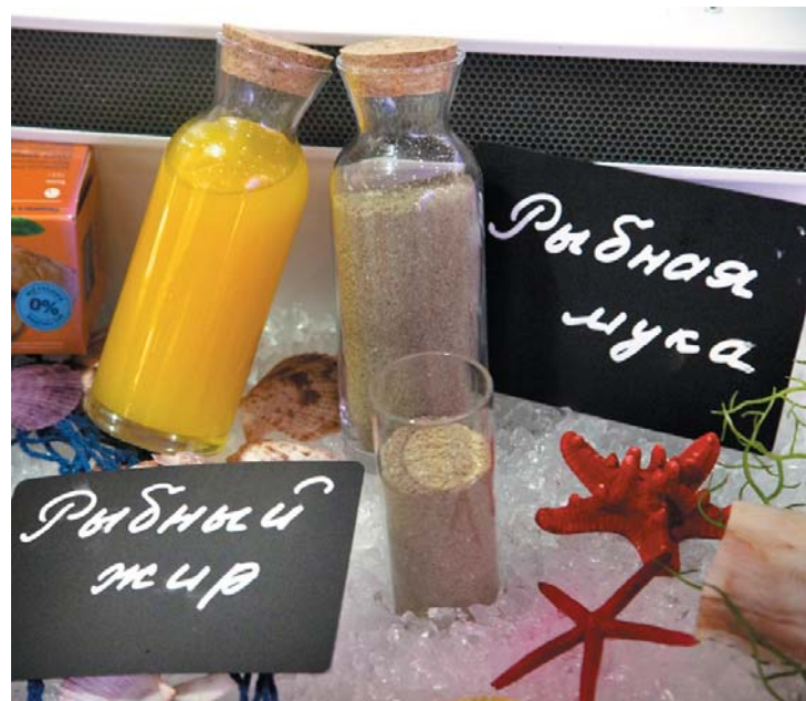
Аналитики отмечают значительный рост импорта рыбьего жира и рыбной муки различными европейскими странами

Медиахолдинг Fishnews — информационный партнер Expo Solutions Group. FN