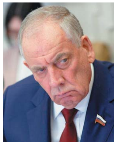
Сергей МИТИН, первый зампреда комитета СФ по аграрно-продовольственной политике и природопользованию

шает годовую выручку этих заводов, еще 6 таких же предприятий на очереди, — заявил Сергей Митин. — Повторяется история с неправильным использованием навоза, когда штраф превышает годовой доход предприятия и ведет к его ликвидации. Таким образом, получается, мы построили 25 заводов, из них 10 сегодня