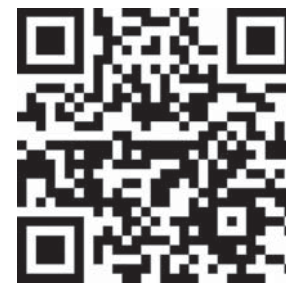
Платформа fishplace.ru выводит компании на цифровой рынок