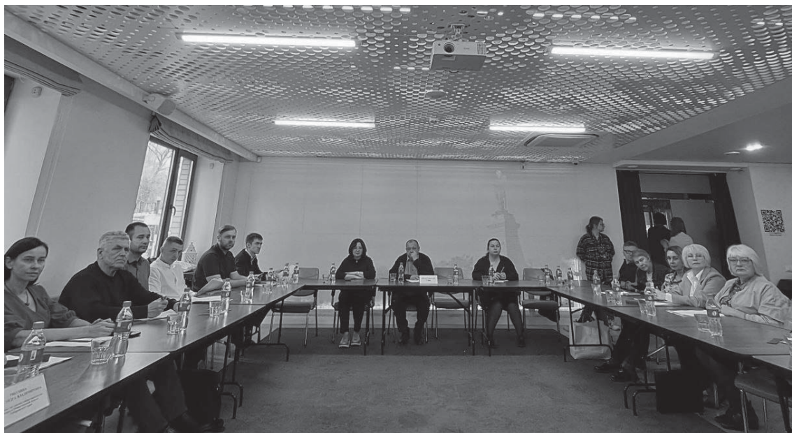
Актуальные вопросы рыбного хозяйства обсудили на общем собрании членов Ассоциации предприятий рыбной отрасли Хабаровского края

Беспокоит пользователей, что будет с их участками при проведении работы по оценке соответствия границ РЛУ требованиям обновленного законодательства, сообщает корреспондент Fishnews. Проект закона о сроках проведения кампании по перезаключению договоров, о соответствии границ РЛУ еще готовится.