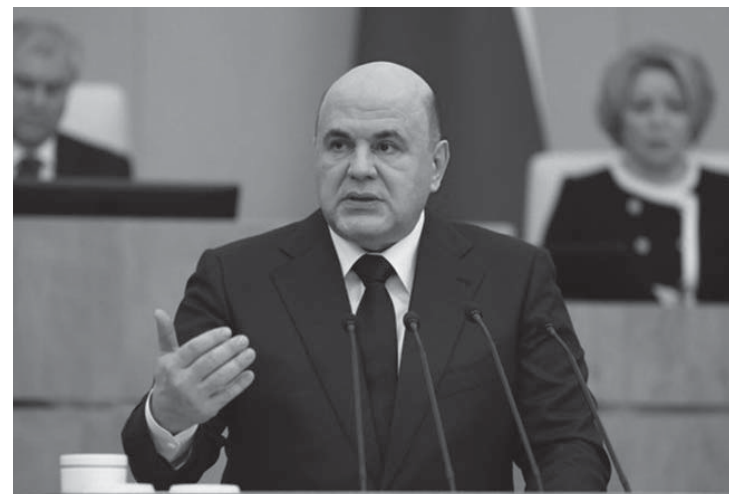
Премьер-министр Михаил МИШУСТИН выступил с отчетом в Госдуме

«Наша цель — привлечение в отрасль инвестиций и увеличение объемов производства, развитие в крае производства изделий и комплектующих для судостроения и судоремонта, в том числе, фигурирующих в различных перечнях импортозамещения», — отметил Сергей Калитин. FN