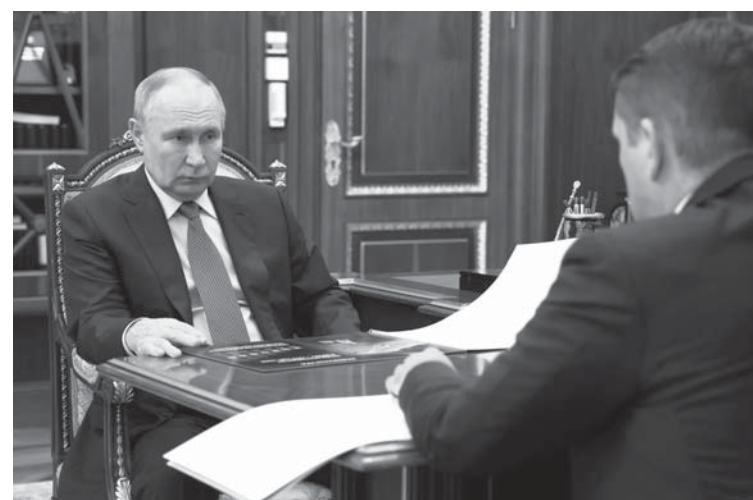
Владимир ПУТИН заслушал доклад о результатах работы рыбной отрасли