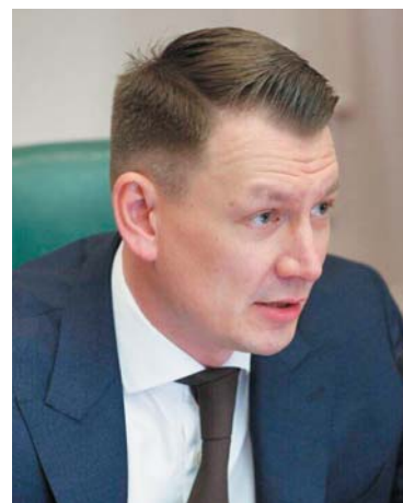
Александр ДВОЙНЫХ, председатель комитета СФ по аграрно-продовольственной политике и природопользованию

Не менее важным, по мнению сенатора, является пре-