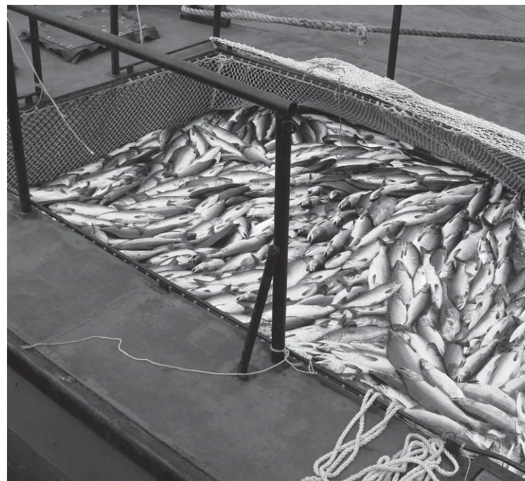
Отраслевая наука прогнозирует объем вылова тихоокеанских лососей в Сахалинской области на уровне 90 225 тонн