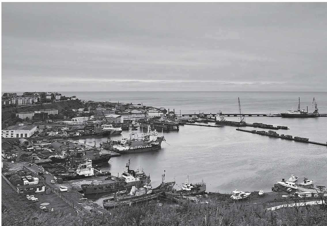
По мнению губернатора региона, модернизация Корсаковского порта — это ключ к развитию Сахалина

В связи с этим губернатор попросил перенести начало финансирования реконструкции порта с 2025 г. на текущий год.