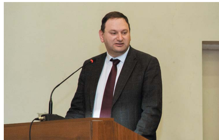
Евгений КАЦ, директор департамента регулирования в сфере рыбного хозяйства и аквакультуры Минсельхоза