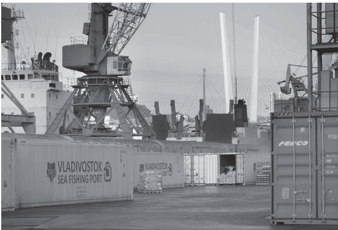
В 2023 году порт принял в общей сложности более 350 тыс. тонн рыбной продукции