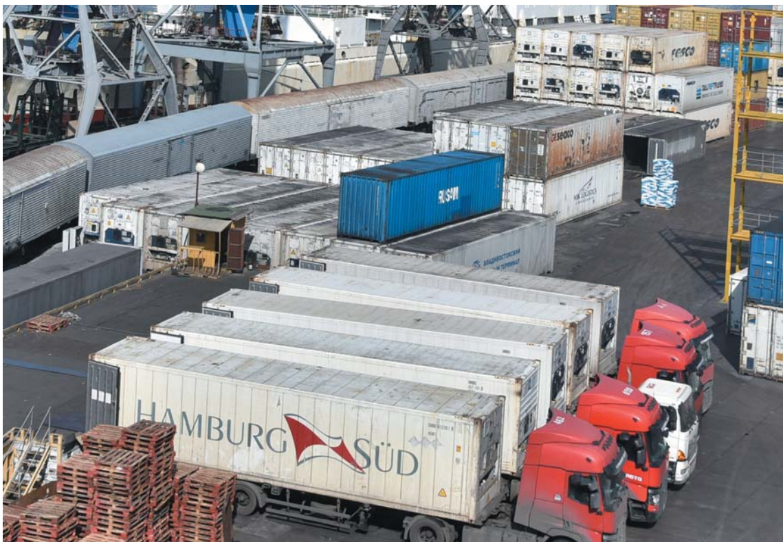
Основными инструментами поддержки экспорта могут выступать льготное кредитование, вхождение в капитал проектной компании или компенсация скидки на поставляемые на объект оборудование и технику