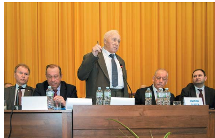
Василий ГЛУЩЕНКО, председатель правления Росрыбхоза