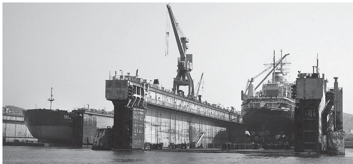
В кластер собирается войти, в частности, Славянский судоремонтный завод

Также, отметил премьер, готовится новая стратегия развития судостроительной отрасли до 2035 г. Она будет синхронизирована со стратегией ОСК, отметил Михаил Мишустин. FN